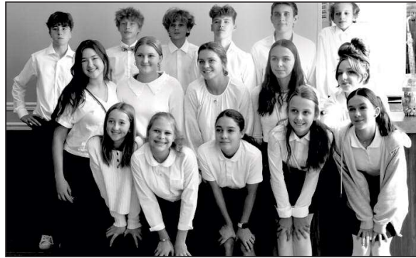
„Derliaus Pietų” metu savanoriavę jaunieji ateitininkai.