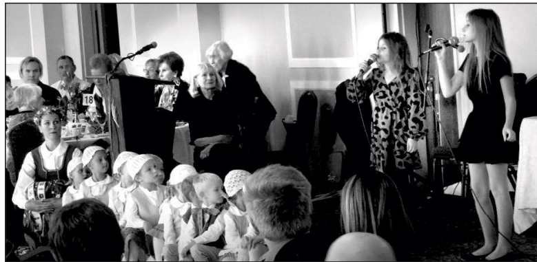
Pietų svečiams dainavo, šoko ir maži, ir dideli.

Norintys sužinoti daugiau apie šią ypatingą organizaciją kviečiami aplankyti www.childgate.org internetinėje svetainėje.