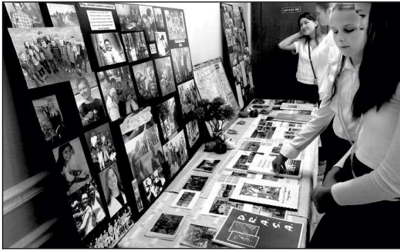
Jauimas apžiūrėjo salėje eksponuojamą parodą ir susipažino su organizacijos „Vaiko vartai į mokslą” istorija.